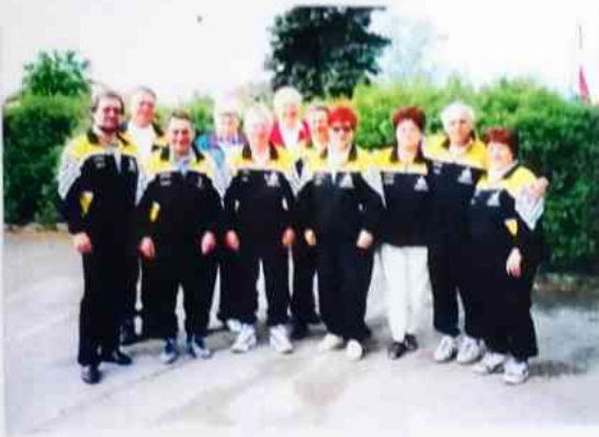
Alljährlich ein Pflichttermin für unseren Verein.